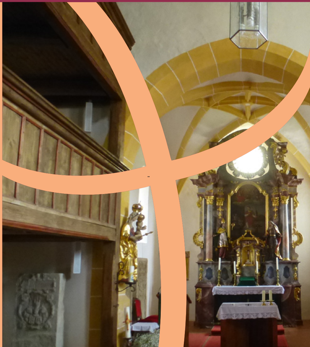
St. Laurentius Kürnberg: Simultankirche des Jahres 2026