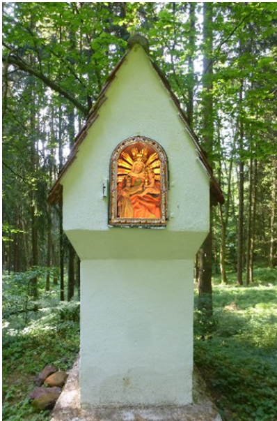
Marterl im Peutental und Anna vom Annaberg als Fotomontage

Etwa einhundert Jahre vorher wurde im Peutental bei Bernried die Kapelle der Heiligen Anna geweiht. Ihr Gnadenbild, das nicht nur zum Annafest als Heilige Anna Selbdritt auf dem Annaberg in Sulzbach verehrt wird, ist jedoch vermutlich deutlich jünger.